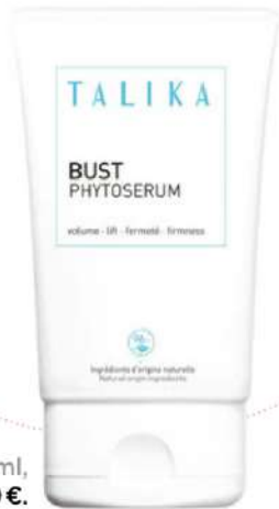
Bust PhytoSerum, 70 ml, Talika, 48,80€.