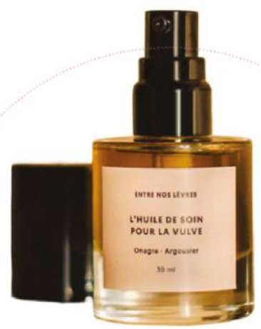
L'Huile de Soins Pour La Vulve, 10 ml, Entre nos lèvres, 28€.

L'entrecuisse ne se limite plus à l'hygiène et à la sphère médicale. En intégrant cette zone aux routines bien-être, des marques aident à dédramatiser un sujet encore empreint de gêne, voire de non-dits. Sa cosmétique se veut plus sensorielle, sans négliger des formules aussi respectueuses que possible. Hydratation, irritations, sécheresse... tout y passe. Même le microbiome, comme pour le visage ou le cuir chevelu.