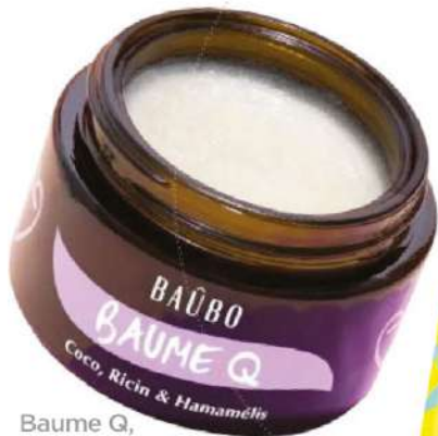
Baume Q, 50 ml, Baübo, 49,50€.

Avec l'essor toujours renouvelé du bodycare et encore plus face à la pression du fameux summer body, le soin du postérieur s'épanouit . D'autant qu'entre risques de relâchement et imperfections, les préoccupations le concernant ressemblent à s'y méprendre à celles du visage... cellulite en plus! Gommages, crèmes et même soins après-soleil ciblés investissent les fessiers avec sérieux et sans complexe.