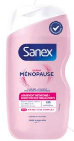
Crème de douche Derma Ménopause, 425 ml, Sanex, 4,95€.