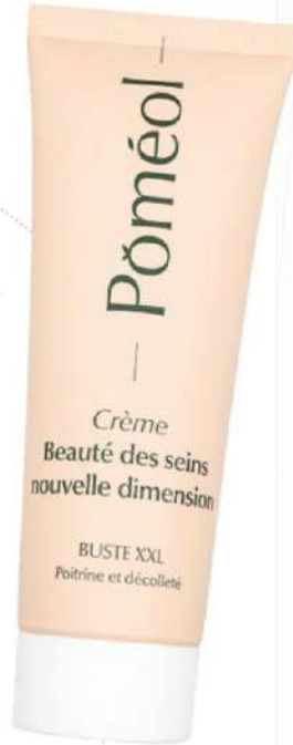
Crème Beauté Des Seins Nouvelle Dimension, Buste XXL, 120 ml, Pôméol, 31,90€.