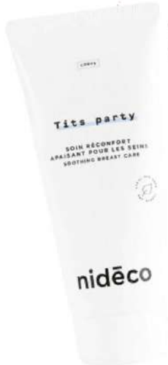
Soins Réconfort Apaisant Pour Les Seins Tits Party, 100 ml, Nidēco, 26,90€.

Longtemps cantonné aux seules préoccupations médicales ou à l'allaitement, le soin des seins entre enfin dans l'univers de la beauté. Sérums, crèmes et gels dopent l'éclat du buste et de la poitrine grâce à des actifs hydratants et raffermissants. Place à des textures enveloppantes qui galbent et repulpent cette zone ultra sensible, soumise aux variations de poids, aux hormones et au vieillissement cutané.