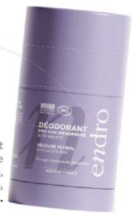
Déodorant stick Pro-Âge Ménopause, 50 g, Endro, 10,90€.

Loin de l'image d'une épreuve subie - voire du début d'une fin de vie! -, la ménopause s'accompagne désormais avec plus de douceur. Les marques sont bien plus nombreuses à l'aborder, les packagings plus joyeux et le bien-être enfin au rendez-vous. Galéniques réconfortantes, formules adaptées, supplémentation ciblée... tout un écosystème se développe autour de cette étape incontournable de la vie.