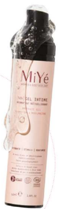
Gel Intime Hydratant Rééquilibrant, 50 ml, MiYé, 23€.