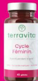
Compléments alimentaires Cycle Féminin, pot de 45 gélules, Terravita, 15,90€.