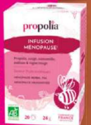
Infusion Ménopause, 20 sachets, Propolia, 6,90€.