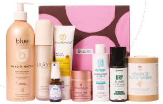
Box Ménopause Glow, Blissim, 38€.