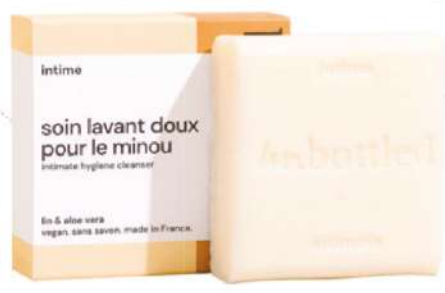
Soin Lavant Doux Pour Le Minou, 90 g, Unbottled, 9,90€.

La beauté investit enfin les zones intimes et les étapes de vie longtemps restées sous silence. Sans disparaître, les tabous reculent, laissant place à une parole plus libre sur le corps féminin. Circulez, il n'y a (presque) plus rien à cacher! Émilie Kremer